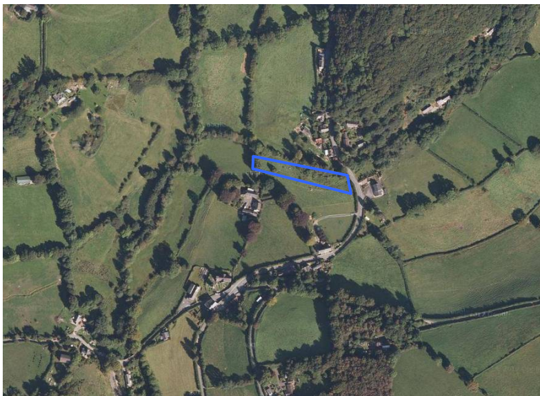
Lluniau © 2012 Bluesky, Infoterra Ltd a COWI A/S, DigitalGlobe, GeoEye, Geomapping plc, Data mapiau © 2012 Google