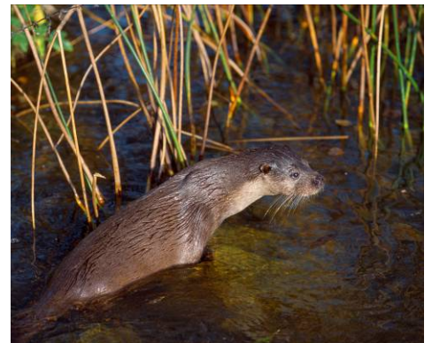
Dyfrgi ( Lutra lutra )

Gall amffibiaid mewn pyllau ddarparu ffynhonnell werthfawr o fwyd ar gyfer dyfrgwn.